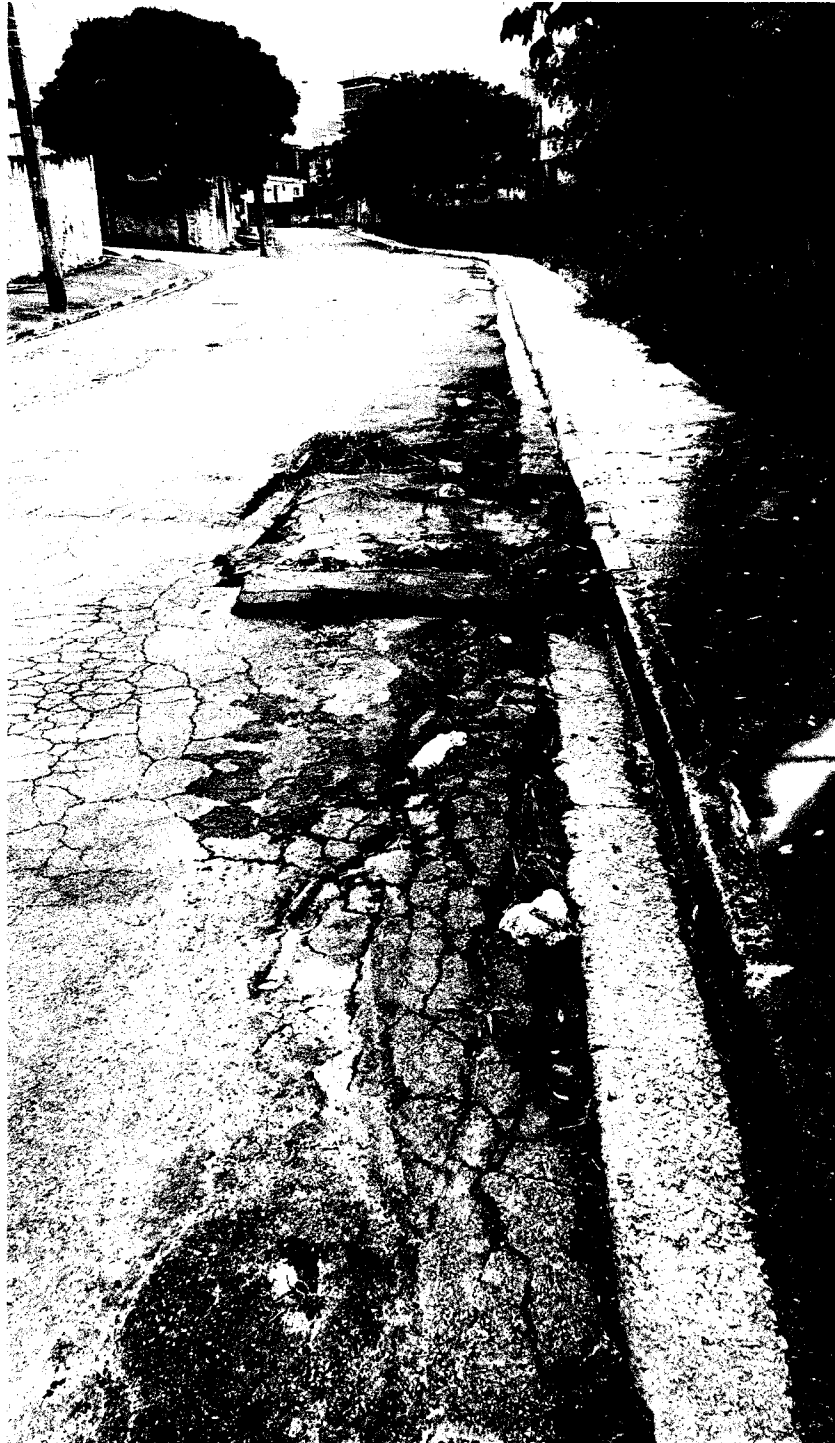
TAPA-BURACO EM TODA A EXTENSÃO DA RUA ANNA MACHADO DA COSTA NEVES, JARDIM PLANALTO – MOGI DAS CRUZES.